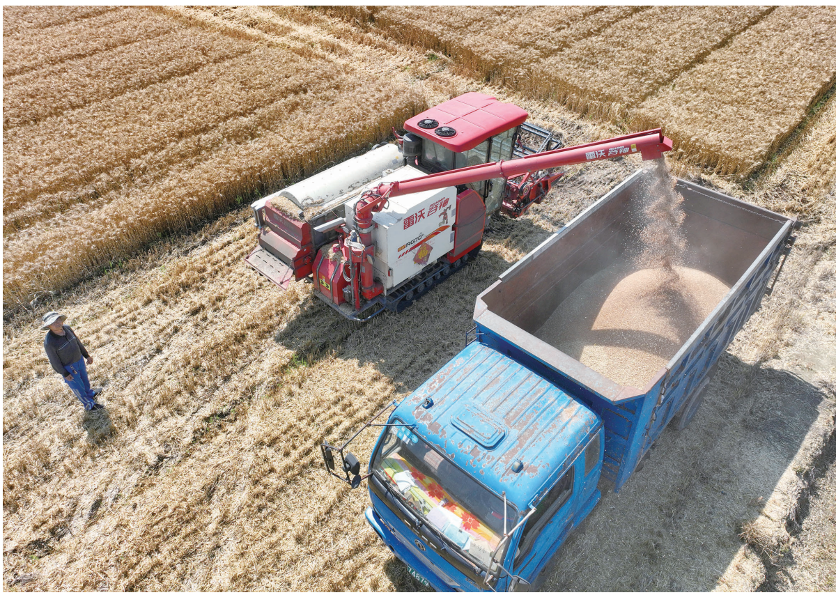
28日,收割机在南通江心沙农场二大队的麦田里忙碌收割、卸运小麦。今年江心沙农场共种植小麦近7000亩,迎来丰收年。“三夏”开展以来,江心沙农场充分发挥“党员先锋岗”带动示范作用,与天气、时间赛跑,抢抓小麦,采取24小时值守烘干、劳动竞赛等方式,确保夏粮颗粒归仓。

四是数字转型再加速。聚焦网上政务服务能力不断提升,最大限度丰富富场景、联通功能、集成服务,强化市县一体化平台枢纽作用,优化公共服务侧电子印章系统全周期服务功能,推动多领域数字证书互验互签,跨区域电子证照互认互通,实现网端、掌端、自助端多渠道政务服务体验并行提升。