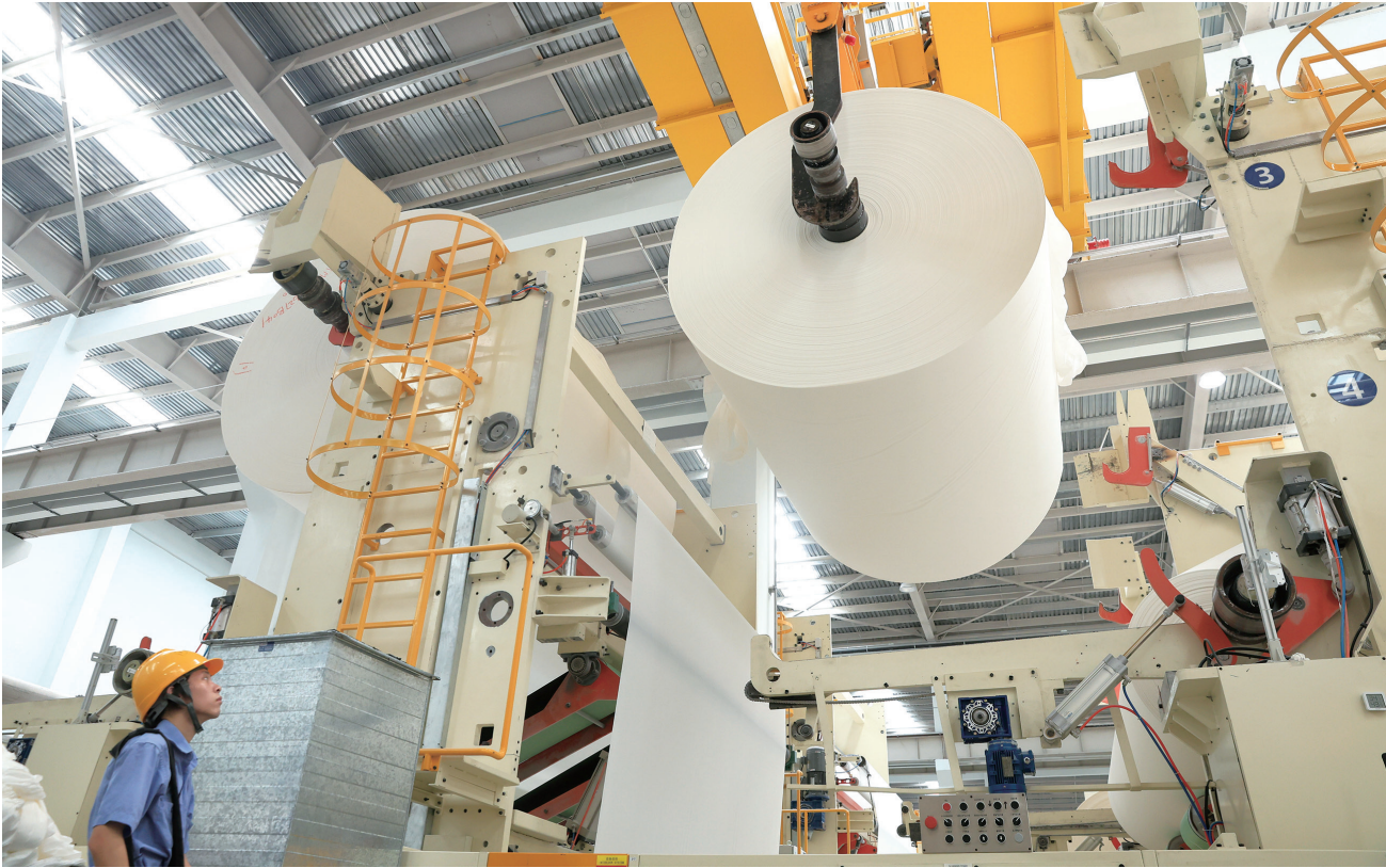
6月28日在如东洋口港经济开发区金光如东产业基地拍摄的生产画面。江苏省重大项目——金光如东产业基地项目是世界最大的、年产78万吨的单一生活用纸生产基地,主要生产“清风”“唯洁雅”等高档生活用纸和纸巾。

据悉,接下来我市外经协会与叶尼塞西伯利亚发展组织将携手策划举办俄罗斯(叶尼塞西伯利亚)投资环境说明会暨项目推介会等活动,推介俄罗斯优质投资项目,增进双方友谊,增强全方位合作。