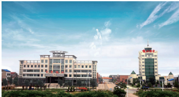
图为百年枝江厂区。

白酒盲评,作为一种“去标签化”白酒品质评判的方式,排除了品牌、包装、价格等因素的干扰,所得结论更为客观,也更能公正地说明酒体的品质。