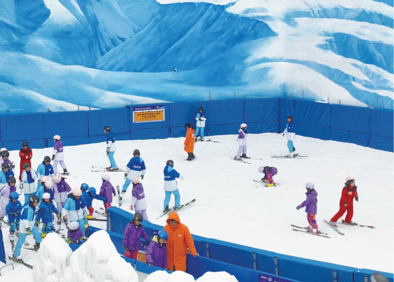
16日,游客在位于崇川区幸福街道的森迪冰雪乐园赏冰玩雪。森迪冰雪乐园是华东地区超大规模室内冰雪主题乐园,总建筑面积5万平方米。暑假开始,森迪冰雪乐园延长营业时间到晚上10点。

记者了解到,6月27日,南通综合保税区(三期)顺利通过省联合验收组验收,至此,南通综保区4.61平方公里实现全域验收。下一步,南通海关将持续加强政策宣贯和业务指导,引导更多区内企业充分享受到改革红利,助力南通综合保税区新一轮高质量发展。