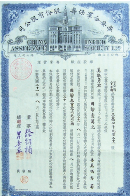
华安合群保寿公司保险单。