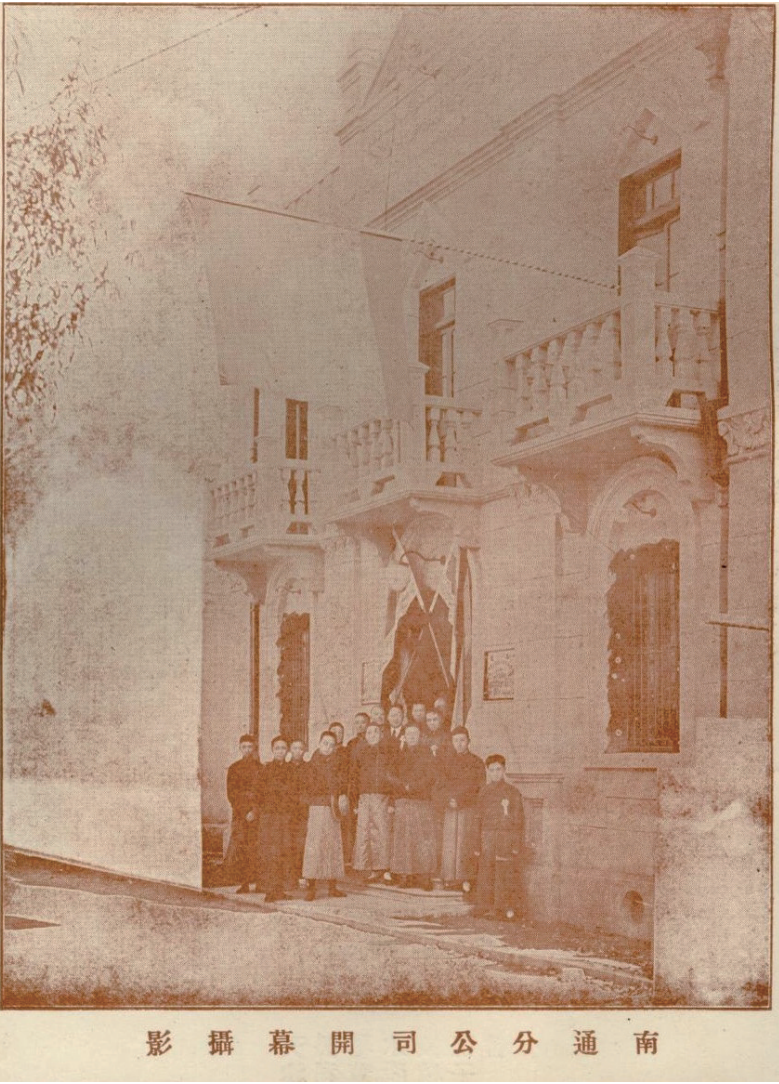
1920年10月,华安南通分公司乔迁模范路(今桃坞路)新厦摄影。

华安合群保寿公司是中国较早的民营寿险公司,向为近代金融史和保险界所推崇,且与张謇及南通都有一定的渊源。但对张謇在该公司创办与发展过程中起到的启迪、支持和推动作用及其在通经营情况,现有记述,内容过简。遂搜罗史料,草成此文,企称补阙漏。