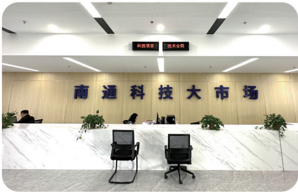
南通科技大市场线下服务平台