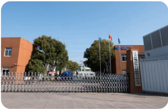
江苏联测机电科技股份有限公司