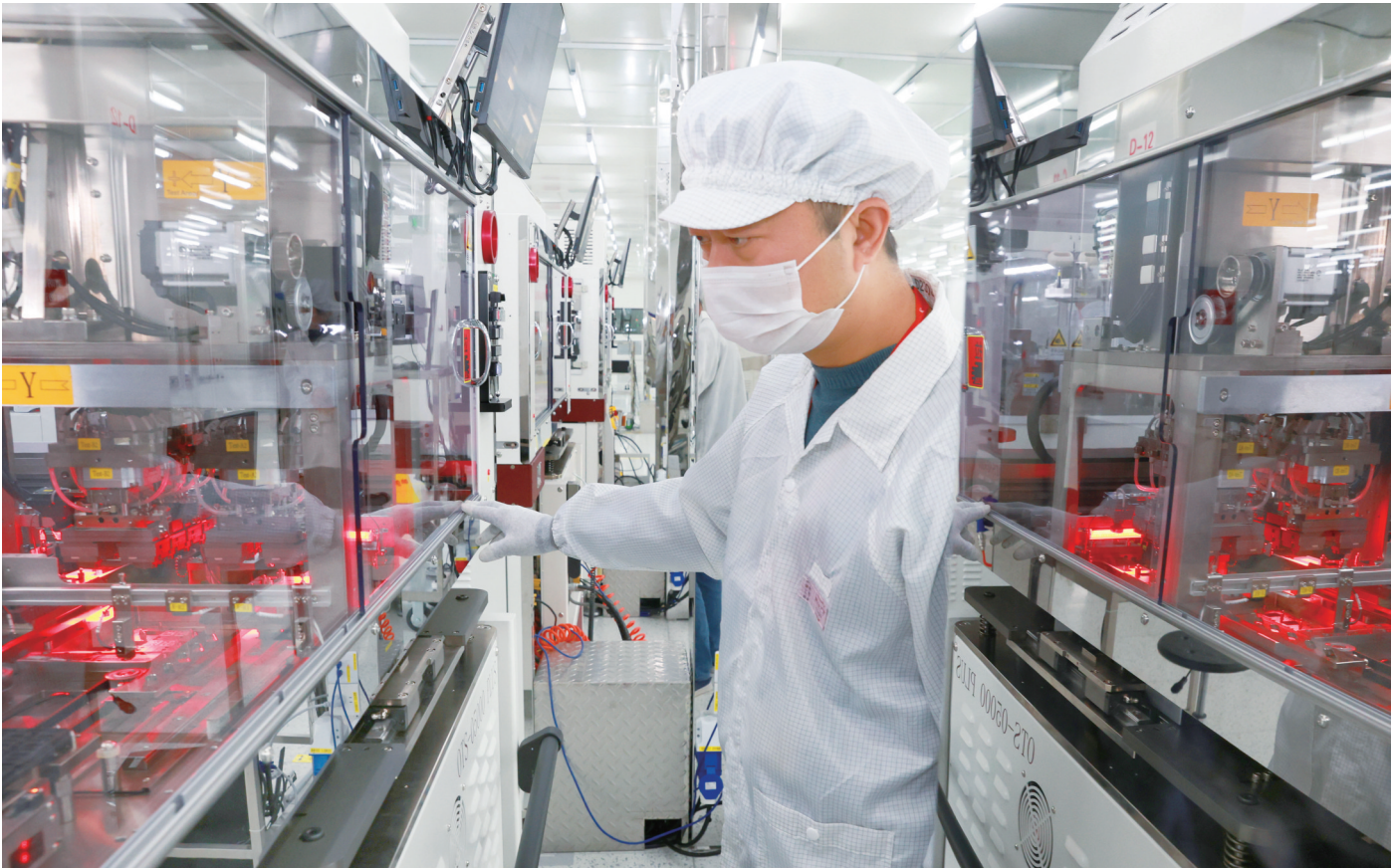
昨日,工作人员在城北高新区通富通科测试车间忙碌。目前,通富通科项目memory存储器、power大功率、HPC微处理器三条产线月产值达5000余万元。