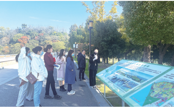
采访组察看五山滨江片区生态修复过程。

本次“文明中国”主题采访活动由中央宣传部、中央精神文明建设办公室组织相关媒体深入基层开展行进式调研式采访，将通过网站、客户端等多平台推出“文明中国”主题报道活动专题，集成展示主题访谈、记者手记、采风图集、系列短视频等融媒体产品，实现全媒呈现、互动传播。