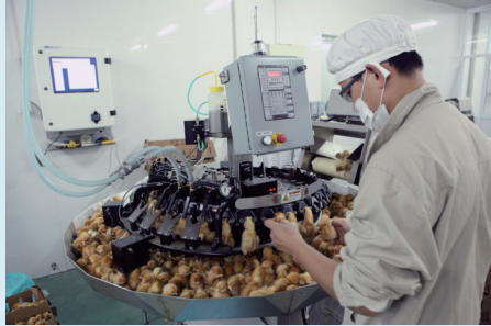
引进美国红外断喙仪