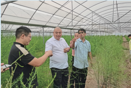
组织外出考察学习