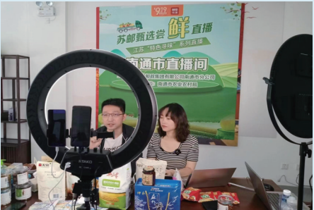
直播助力南通农产品出村进城