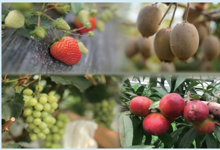
南通水果走俏市场