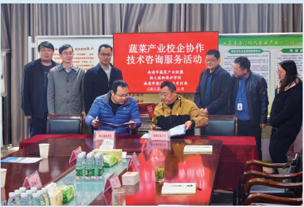
开展校企合作技术咨询服务