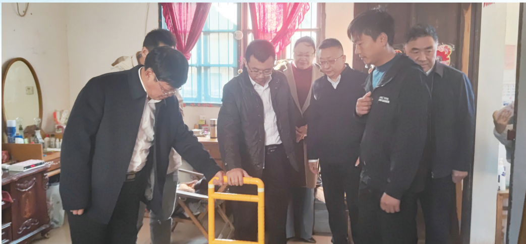
如东县政协调研适老化改造提案办理情况

如东县政协坚持“围绕中心、服务大局、提高质量、讲求实效”的提案工作方针,以“提案不在多而在精”为导向,积极开拓进取,把握高标准要求,推动提案质量、提案办理质量实现“双提升”。