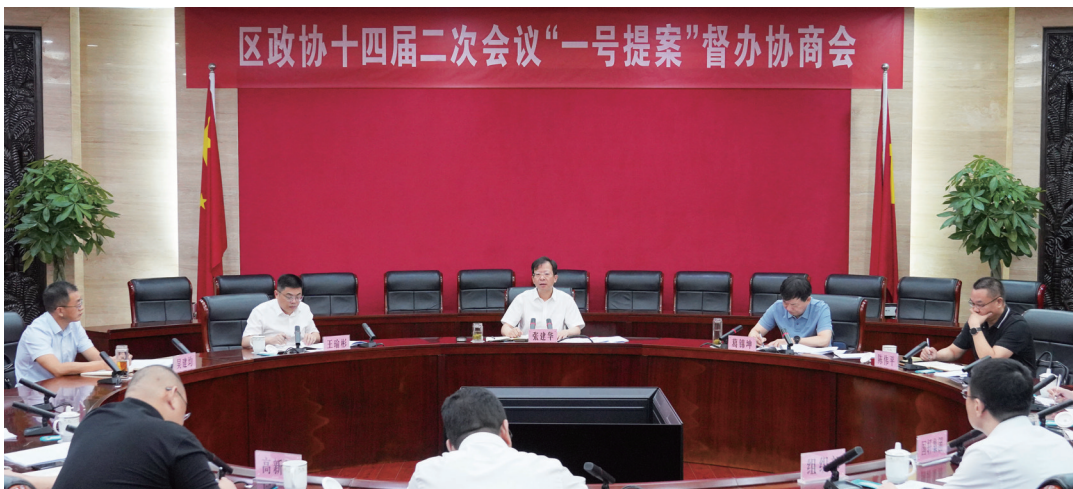
通州区政协召开提案督办协商会

通州区政协紧扣中心、务实监督、精准发力,打造更加高效的民主监督制度闭环,在助力通州争当全市高质量发展排头兵的火热实践中积极贡献智慧力量。