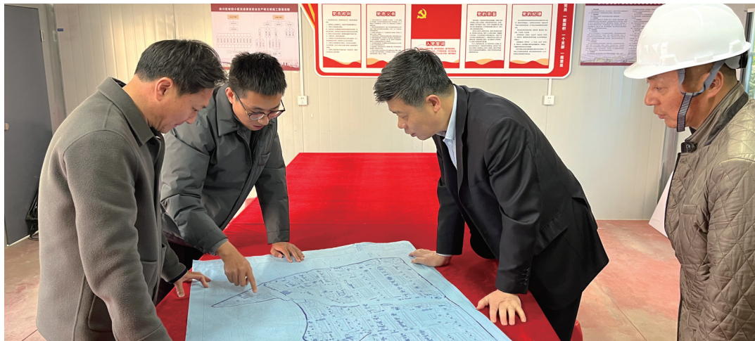
崇川区政协助力老旧小区改造

崇川区政协坚持为民服务导向,创新有事好商量协商议事工作方法,完善开放式、融合式、共享式协商议事平台,积极拓宽基层群众有序政治参与渠道,推动老旧小区改造平稳有序开展,助力构建共建共治共享的社会治理新格局。