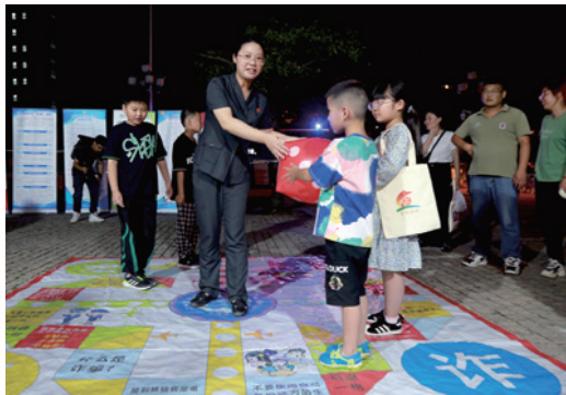
与学田街道新时代文明实践所联合推出“法治夜市”主题系列活动,将普法宣传融入夜间经济。

强化“小案件大民生”理念,审结涉民生类案件11010件。加强消费者权益保护,依法认定销售过期轮胎、3D打印地板等伪劣产品构成消费欺诈,承担惩罚性赔偿责任。突出农民工权益保护,深化劳动争议一体化处理中心运作,持续开展根治欠薪专项行动,快速办理某养老院拖欠46名护工工资等案件,累计帮助追回“血汗钱”5923万元。力促胜诉人权益兑现,全力开展刑事案件“涉案款物追缴”工作,执行到位2.21亿元,其中追缴罚没类款项3808万元,实现“颗粒归仓”。持续推进执行攻坚行动,执结案件11136件,执行到位金额12.8亿元。深化妇女儿童权益保护,编写并出版女性婚恋权益保护书籍,发出家庭教育指导令、承诺书、责任告知书256份,开设家长课堂培训65人次,2名干警被评为南通市首批优秀法官副检察长。法院顺利通过“全国维护青少年权益岗”复核。