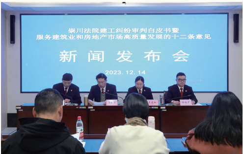
全年召开10场新闻发布会,发布审判白皮书9份、典型案例79个。

积极引导新经济新业态健康发展,妥善审理醉酒乘客被拒载溺亡案,并发送司法建议,推动网约车平台严格限制司机任意取消订单,被中央电视台《法治在线》报道。加强执源治理,创新建立“三养”案件立审执衔接配合机制,督促“亲情债”自动履行。深入践行“两山”理念,主动对接相关部门开展联合普法,妥善审理非法生成船舶通行绿码案、索要“海事费”案,向有关部门发出规范航运市场秩序的司法建议,加强了对长江流域的综合保护。2023年,累计发出“数助治理”白皮书和司法建议25份,其中《关于加强娱乐场所监督管理,保护未成年合法权益的司法建议》被评为全省优秀司法建议。