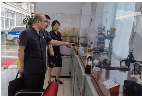
院领导率队走访重点企业,精准问需献策。

严防金融领域风险,全国首例判决保险行业涉“黑产代理”服务合同无效,审结全省职业放贷入刑第一案,就银行债权收回顺序不合理、保险公司保险条款不规范等问题提出治本之策。崇川法院荣获全省法院金融审判工作先进集体。