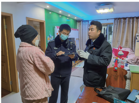
深入推进执行攻坚,全市首家建立“网格+执行”联动机制、保险产品执行联动机制。

注重多办案、快办案,也要办好案。充分发挥司法裁判价值导向功能,判决不当护理致老人噎哈死亡的护理院承担赔偿责任,弘扬敬老护老道德风尚,该案入选江苏法院老年人权益保护典型案例。支持保险公司拒赔开“斗气车”引发的事故损失,引导群众遇事包容礼让、冷静处理,该案入选江苏法院弘扬中华优秀传统文化典型案例。