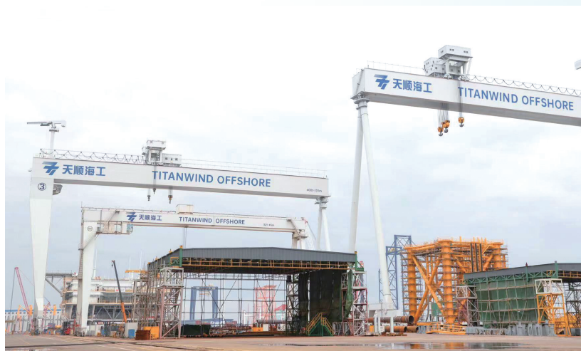
天顺海工装备(江苏)有限公司

园区即景区,商务即旅游,通州湾示范区积极探索文旅商高质量发展,新签约中高端城市功能项目15