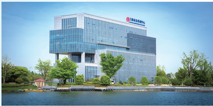
上海市北高新(南通)科技城

上海市北高新(南通)科技城入选“科技城百强榜”!2023年12月,市北高新区传来喜讯:赛迪顾问城市经济研究中心发布《科技城百强榜(2023)》,上海市北高新(南通)科技城榜上有名,南通唯一。 上海市北高新(南通)科技城是沪通两地落实长三角一体化国家战略,深化两地经济交流合作的重大项目。2010年启动时,科技城所在地还是一片乡村田野,如今这里已集聚各类企业260余家,总投资超400亿元。 产业强则经济强,产业兴则百业兴。上海市北高新(南通)科技城的跨越发展历程,是崇川坚持产业强区、推动产业量质齐升的生动诠释。 楼上楼下五层、约260平方米的实