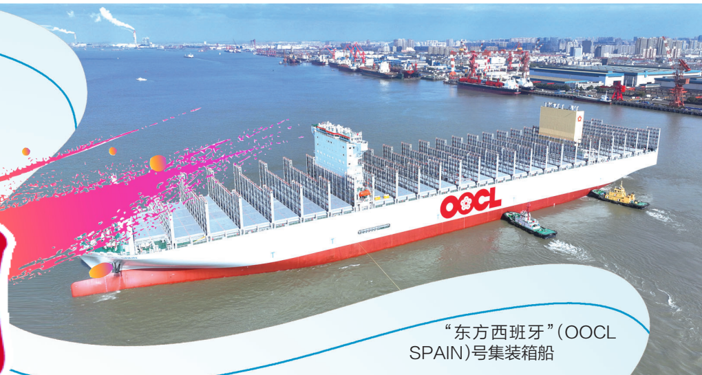
“东方西班牙”(OOCL SPAIN)号集装箱船

偌大的车间里工人寥寥无几,AGV无人驾驶物流小车来回穿梭……走进大生集团“智慧工厂”,眼前的景象让人对“智慧”二字,感受深切。 前不久,大生集团获评国家级智能制造示范工厂,全市唯一。去年3月,大生集团“10万锭智慧纺纱工厂”全面达产,树立了中国智能纺织的新典范。 创新不止,生生不息。百年大生以始为终、惟新惟进,是主城崇川敢为善为的生动缩影。 以勇挑大梁的责任担当,拼经济、稳增长、强动能。刚刚过去的2023年,主城崇川交出了一份厚重提气的高质量发展“年终答卷”。 2023年预计实现地区生产总值1750亿元,增长6%;一般公共预算收入113亿元,与去年持平;城镇居民人均可支配收入68800元,全市最高。地区生产总值等7项指标总量全市第一,建安投资等12项指标增速高于全市平均水平。