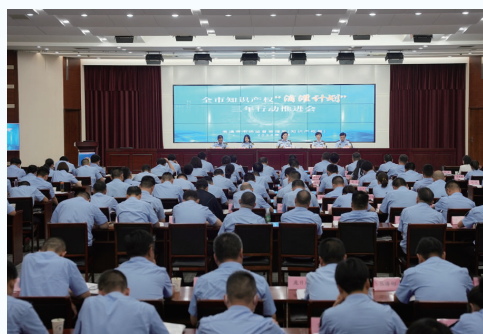
全市知识产权“滴灌计划”三年行动推进会召开

中天海缆的“海底电缆及其制造方法”,沃太能源的“户用储能壁挂式逆变器(新型)”……2023年,我市共获第二十四届中国专利奖9项、首届江苏专利奖7项,一批闪耀的高价值专利硕果,见证着知识产权强市建设的铿锵步伐。