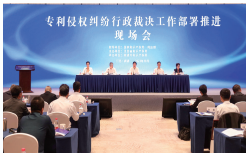
全国专利侵权纠纷行政裁决工作部署推进现场会在南通召开

司法保护增效,加速凝聚合力。我市创新实施知识产权民事、行政、刑事案件“三审合一”及刑事、民事、行政、公益诉讼“四检合一”机制,知识产权“严、大、快、同”保护格局逐步完善。