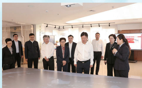
国家知识产权局副局长胡文辉调研“知联侨”知识产权海外服务中心

随着知识产权公共服务体系加快建设,知识产权服务供给水平不断提升。南通大学高校国家知识产权信息服务中心揭牌运行;“知联侨”知识产权海外服务模式入选知识产权强国建设第二批典型案例。去年,全市新增专利代理主营服务机构5家,省级知识服务业集聚区通过评估验收。