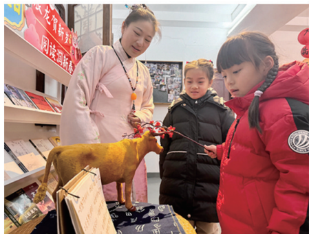
▲剑山、园林、洪江、曹公祠社区联合开展“辰龙贺新岁,阅读润新春”民俗文化活动。