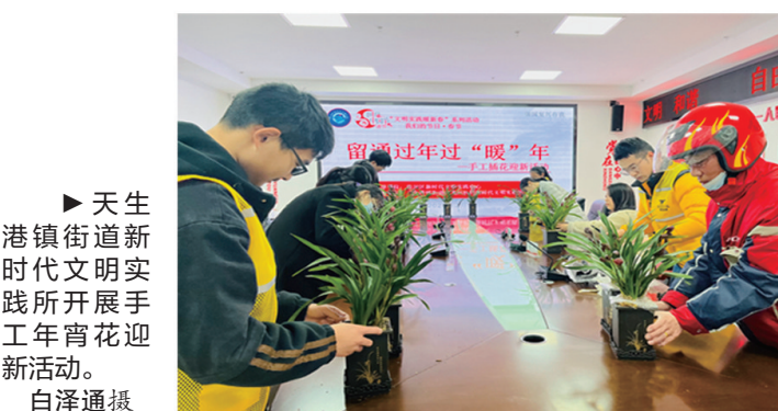
►天生港镇街道新时代文明实践所开展手工元宵迎新活动。