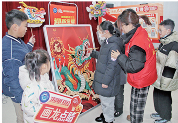
▲濠西、起凤社区联合开展“迎新送福 画龙点睛”活动。