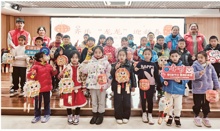
▲中心村、校北村社区联合开展迎新新春活动。