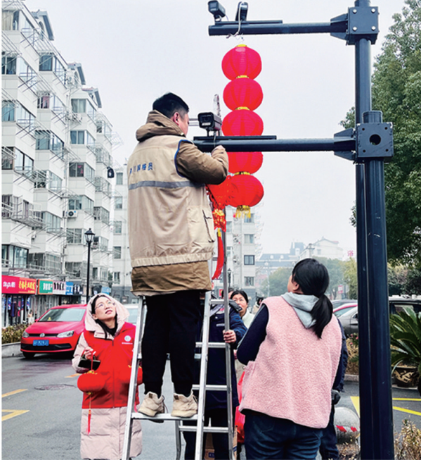
►天生港镇街道新时代文明实践所开展手工元宵迎新活动。