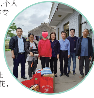
市人社局上门慰问

小姑娘很喜欢画画，于是志愿者为她准备了梦寐以求的画具套装作为“六一微心愿”礼物，同时还帮她分析走艺术之路需要具备的条件，让她能更好地规划自己的未来。爱心志愿者表示，将继续做好结对帮扶工作，让“大手牵小手，一起向未来”开出爱的花，结出美的果。