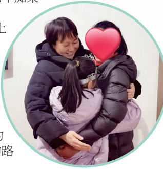
市水利局走访慰问

派送“六一微心愿”暖心礼并送上节日祝福；精心策划了一场人文之旅……市水利局“爱心妈妈”和孩子们由陌生到熟悉，从初次相见的拘谨到再次相见的期待，再到见面后的无话不谈，相处的时间越来越长，心越走越近。爱心妈妈们说，孩子们期盼的小眼神和开心的模样，以及给予我们的那份信任，足以赶走任何辛劳，再远的路程都值得用心用情奔赴。