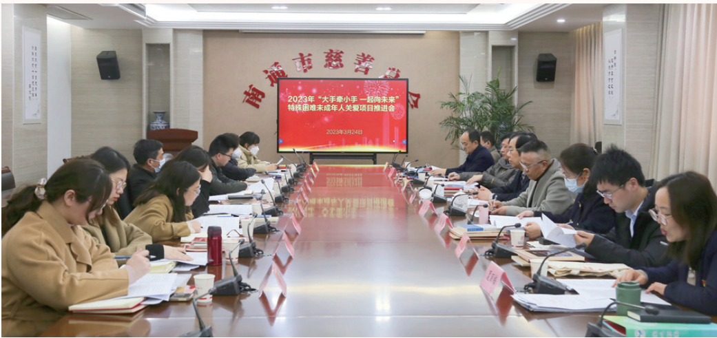
“大手牵小手 一起向未来”特殊困难未成年人关爱项目推进会

来自市慈善总会的统计数据显示，截至2023年12月底，“大手牵小手 一起向未来”特殊困难未成年人关爱项目，累计发放关爱资金551.75万元，惠及各类困境儿童2743人次。 2022年3月份，市慈善总会聚焦困境儿童需求，聚焦社会关注，联合市文明办、市委、市机关工委、市民政局、市教育局、市妇联、团市委、市关工委等8部门，共同发起“大手牵小手 一起向未来”特殊困难未成年人关爱项目，在整合现有各类困境儿童帮扶举措基础上，对其中特殊困难未成年人进行重点帮扶、精准帮扶、系统帮扶、跟踪帮扶，多点发力打出组合拳，守护困境儿童健康成长。 目前，项目共有关爱对象948名，“一对一”结对关爱对象843名。项目先后被评为2022年度中华慈善品牌项目、第四届“南通慈善奖”最具影响力慈善项目。