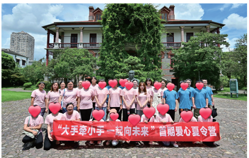
爱心夏令营——参观南通博物苑

一个基金确保一助到底。 项目实施以来，累计发放关爱金550多万元，惠及各类困境儿童2743人次。2023年9月，30名关爱对象以优异成绩顺利录取中国农业大学、南京财经大学、江苏师范大学等高等院校，后期还将给予持续关爱，一助到底，直到大学毕业走上工作岗位，成为社会有用之才。