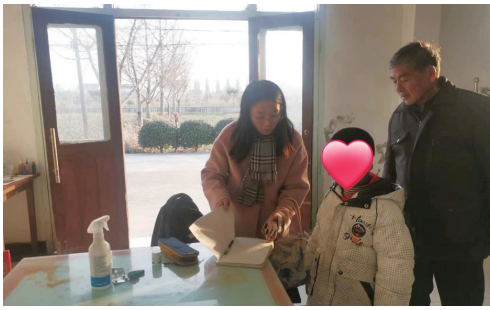
市委党校走访慰问

及时下发细化实施方案，并以条线为单位，建立爱心工作群，随时在群里答疑解惑。疫情期间，多次通过工作群发出倡议，为关爱家庭提供就医指导、药品互助等急难帮扶，帮助他们顺利渡过特殊时期。邀请德育专家作为项目顾问，开展志愿服务专业培训，通过《成长有烦恼 关爱靠技巧》等主题讲座，帮助大家以专业技术学习如何做好孩子们成长道路上的人生导师。持续规范项目实施，引入第三方评估机构，对关爱资金落实和亲情关爱情况进行抽样调查，听取困境儿童、监护人及志愿者的意见建议，提出项目完善建议，调研范围覆盖全市域全学段，困境儿童及其家属满意率100%。