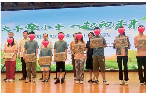
南通日报社赠送书籍

一个项目激发一城爱心。 项目尤其注重资源整体联动，市委、市机关工委把结对关爱列入党建融合项目，引领50多个部门机关党支部和1000多名爱心妈妈与困境儿童一对一、多对一结对，凝聚集体智慧“一人一策”量身定制关爱方案，为孩子们提供全方位、全链条、全周期的关爱服务。目前常态化结对843对，累计开展线下入户走访慰问