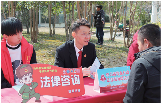
▲永兴街道开展法律咨询志愿服务活动。