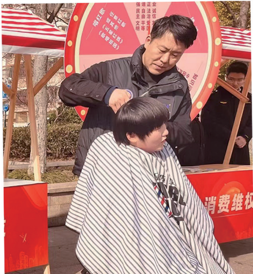
▼天生港镇街道开展义剪志愿服务活动。