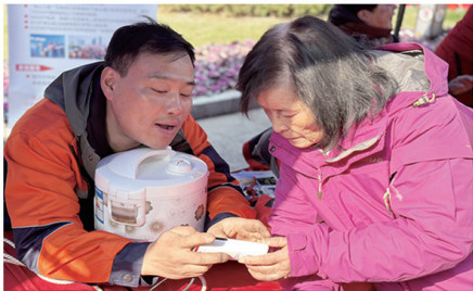
▲和平桥街道起凤社区联合飞牛小匠志愿服务社为居民提供维修小家电、磨刀等便民服务。