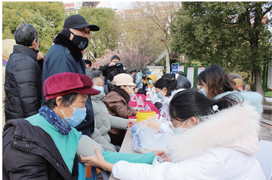
▲新城桥街道朝晖社区联合南通市第三人民医院开展“惠民义诊送健康”志愿服务活动。