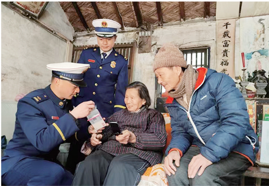
▲天生港镇街道泽生社区联合天生港消防救援站开展“冬训微践行 蓝焰追‘锋’者”志愿服务活动。