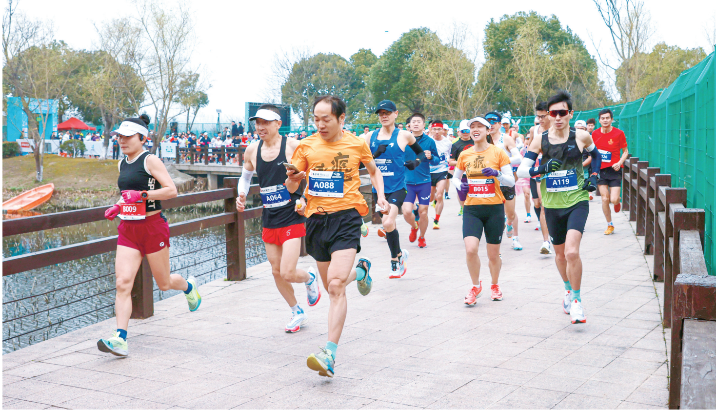
昨天,南通开发区第二届老洪湿地公园半程马拉松比赛举行,来自全市的200多名运动员参加了本次比赛。

风力方面,新一周风向多变,风力一般为陆上4级左右、沿江江面4—6级、沿岸海区5—7级,其中22日东南风较大,陆上和沿江江面5—7级、沿岸海区6—8级。