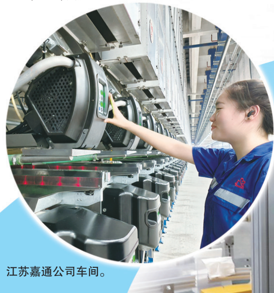
江苏嘉通公司车间。