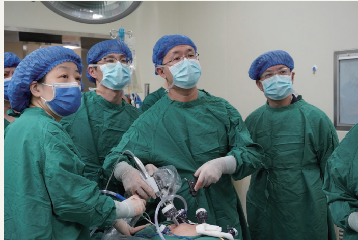
引进先进技术,提升服务水平