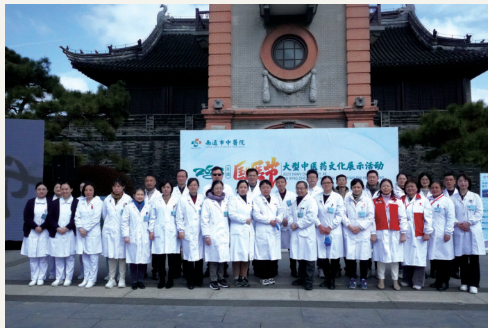
“庆祝国医节”大型中医药文化展示活动