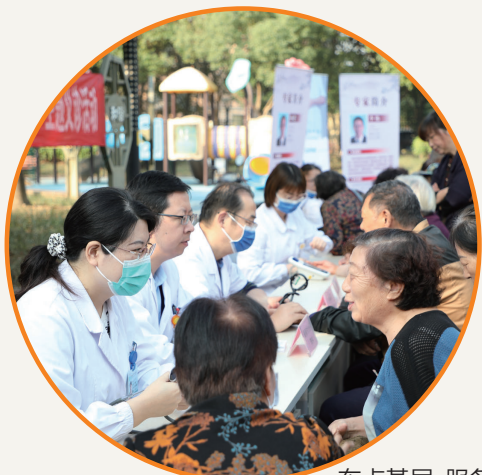
布点基层,服务群众

两院并行,硬件和软件同步提升,发展实效是检验方向规划的“试金石”。这一次,市中医院走得步履铿锵。