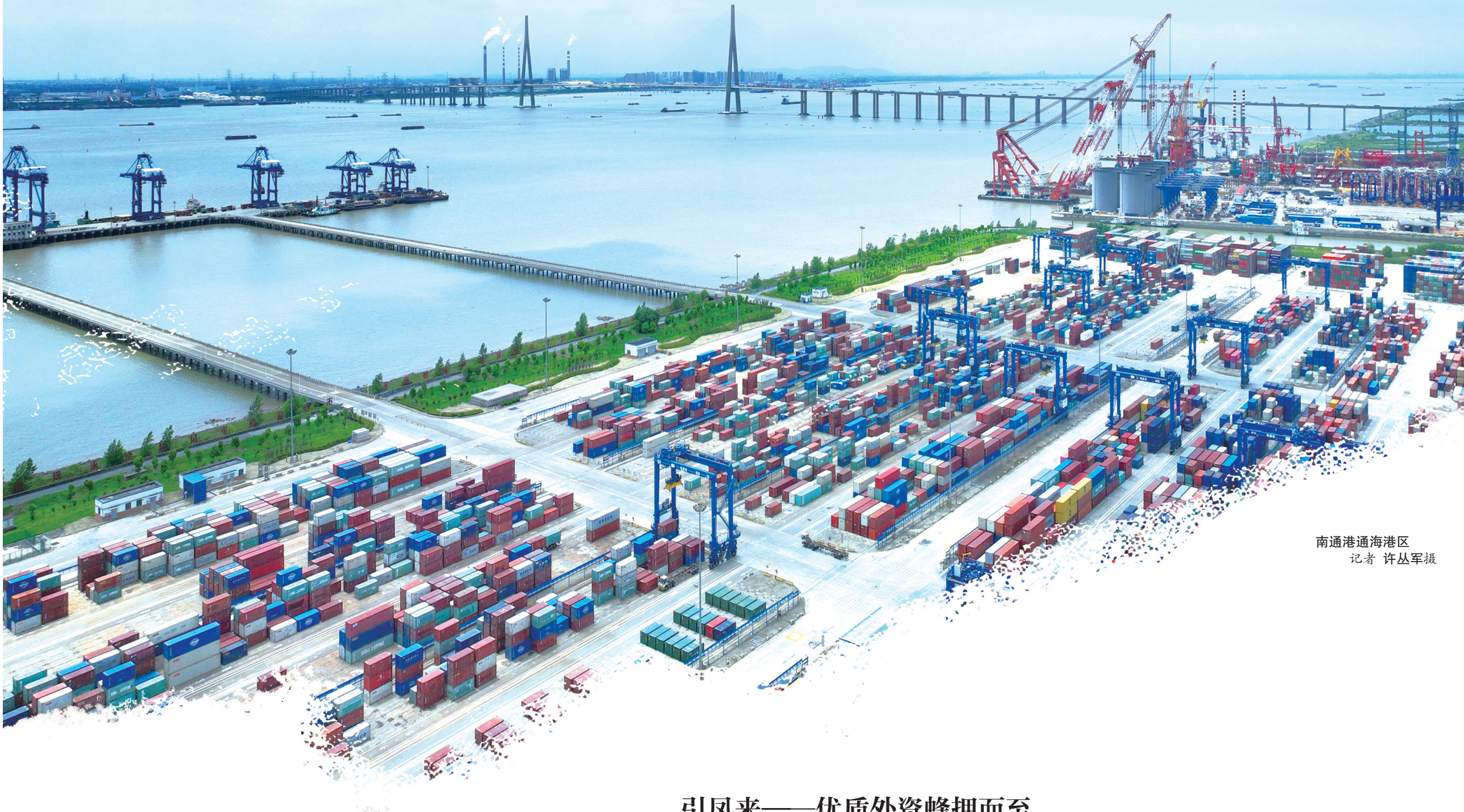
南通港通海港区