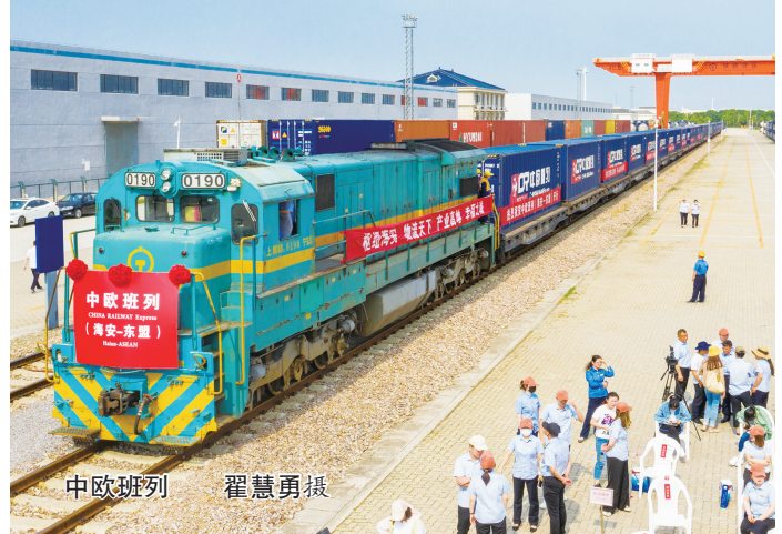
中欧班列

截至目前，全市有对外承包工程和劳务合作资质企业54家，其中5家企业入选美国《工程新闻纪录》(ENR)“全球最大250家国际承包商”榜单，数量占全省60%、全国6.2%，列全国地级市首位；全市27家建筑特级资质企业中，有11家具备国家援外项目资格，约占全省1/2，列全国地级市首位。