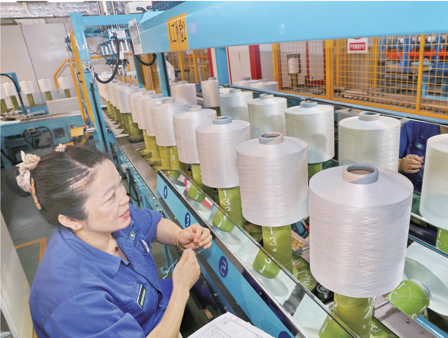
5月31日,通州区恒力(南通)产业园江苏恒科新材料有限公司加弹质检车间,工人正在抓紧生产。恒力(南通)产业园装备国内首套全流程数字化智能化纺丝、检验、包装仓储设备,实现了对生产状态、质检数据、包装仓储信息等实时监控和系统化管理。

“家庭是预防和抵制腐败的一道重要防线,大家要自觉抵制不正之风……”先锋街道花园村内,街道纪工委书记正利用“清风庭院