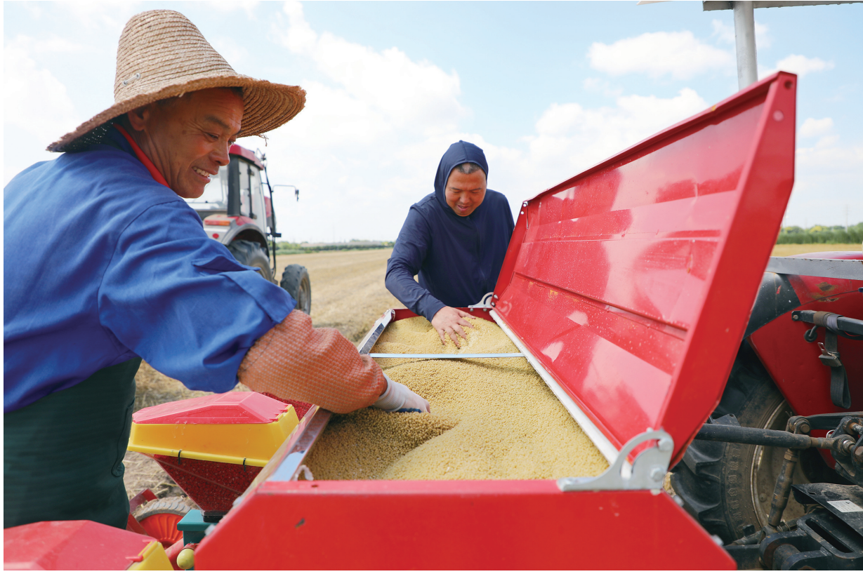
6日,江心沙农场抢抓晴好天气,组织农机力量压茬推进鲜食玉米种植。播种机在田间来回穿梭,边播种、边施肥,有效提高作业质量和效率,为特色农产品种植“有品质、有产量、出成效”打下坚实基础。

2023年,中国科协等8部门《关于加强新时代老科学技术工作者协会工作 更好发挥老科技工作者作用的意见》及江苏省科协等8部门《实施意见》下发后,我市更好发挥老科技工作者作用联席会议成员单位及时学习贯彻,市科协牵头起草了贯彻中央和省8部门文件的《实施意见》。《实施意见》包括深刻认识新时代做好老科协工作的重要意义、积极搭建为老科技工作者热心服务的平台、全面营造新时代老科协工作温馨环境等5个方面18条内容,具有职责明确、任务具体、操作规范的特点。