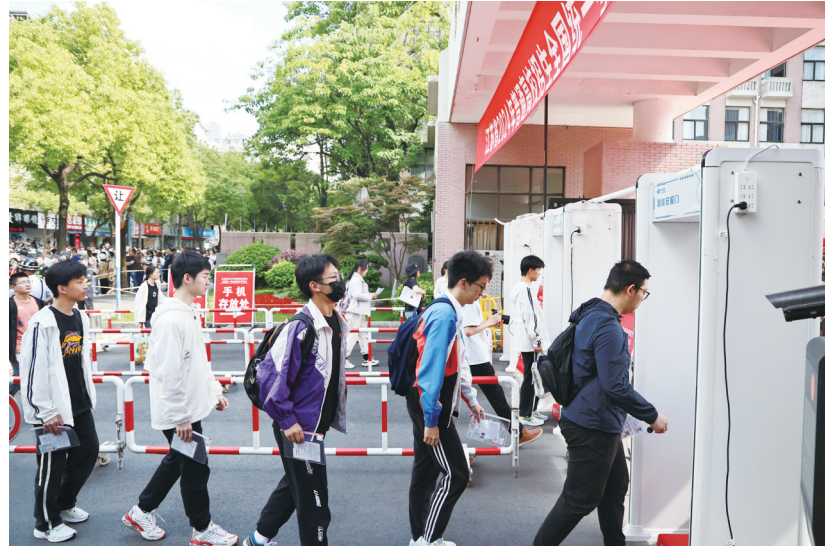
6日,考生陆续走进南通中学考点。2024年普通高校招生全国统一考试在即,当天,在南通中学考点,考生通过试座、听广播播音等熟悉考场环境,积极应考。

打击违法犯罪,守护绿水青山。全市公安机关将继续强化责任担当,坚定践行“绿水青山就是金山银山”理念,以“昆仑2024”、固体废物专项打击治理、长江大保护等专项行动为抓手,持续严打生态环境领域违法犯罪,切实保障民生、维护稳定、服务发展,为守护绿水青山、高水平建设新时代美丽南通作出新的更大的贡献。