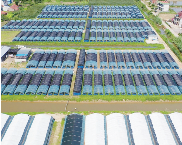
康华水蛭养殖基地。