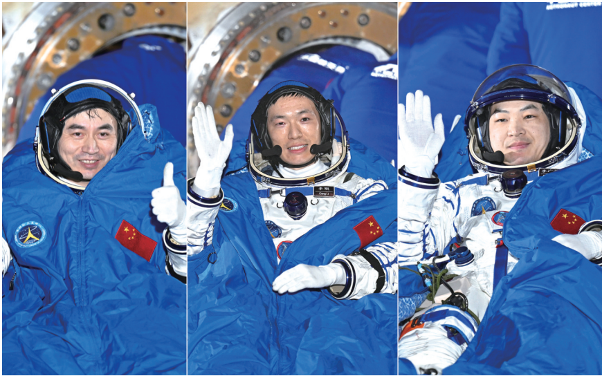
昨日,神舟十八号航天员叶光富、李聪、李广苏(从左至右)安全顺利出舱(拼版照片)。

据新华社酒泉11月4日电 神舟十八号载人飞船返回舱4日在东风着陆场成功着陆,神舟十八号乘组在轨飞行总时长达到192天,刷新我国航天员乘组在轨飞行时长新纪录。中国空间站第七批空间科学实验样品当天亦随神舟十八号载人飞船返回舱顺利返回。 神舟十八号乘组由叶光富、李聪、李广苏3名航天员组成,3人均为“80后”,都有过飞行员经历。指令长叶光富是我国第二批航天员,执行过神舟十三号载人飞行任务,在轨飞行总时长达到375天,刷新我国航天员在轨驻留时间的纪录,成为目前我国在轨飞行时间最长的航天员。李聪和李广苏均为我国第三批航天员,都是首次执行飞行任务。 神舟十八号载人飞船于4月25日在酒泉卫星发射中心发射升空,返回舱11月4日在东风着陆场成功着陆,在轨飞行总时长达192天,刷新此前神