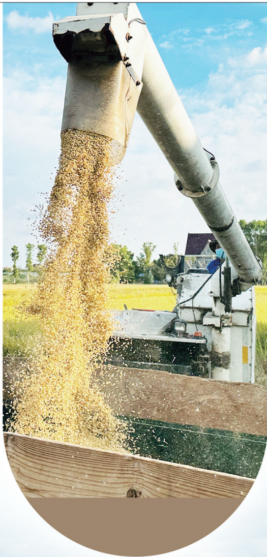
刘桥镇长岸村长富家庭农场水稻开始收割。

本报讯（通讯员张妍 马正祥）近日，通州区五接镇袁三圩村22组河道一改往日水草丛生、脏乱不堪的模样，整体环境整洁干净，水流通畅。