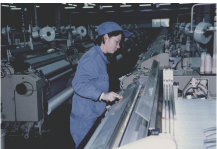
帝人公司早期生产