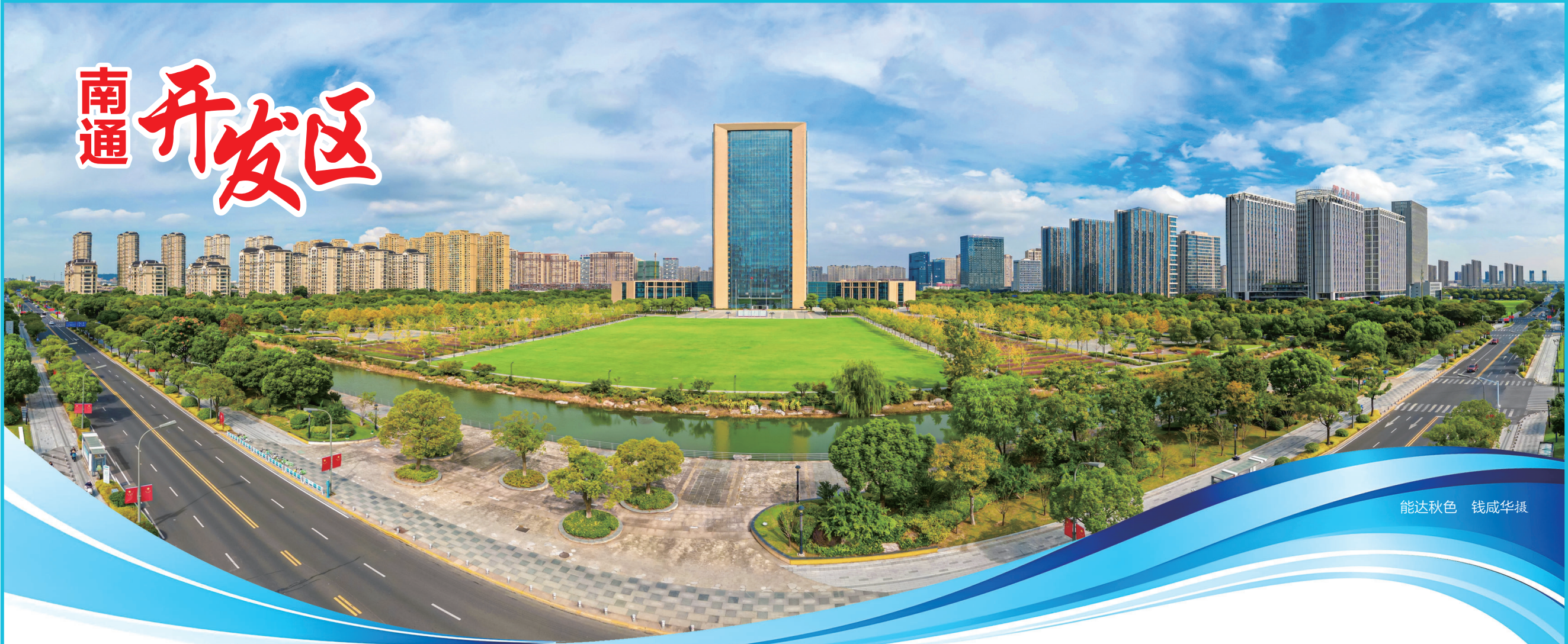
能达秋色