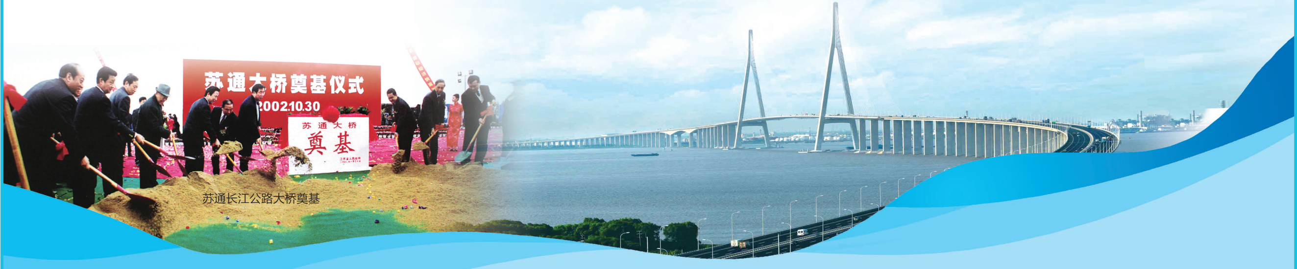
苏通长江公路大桥奠基

年列全省第2名。 “一定要找到南通开发区最本质的、最潜在的、最有吸引力的东西。我们就依托海港和长江港口,靠这个去招商引资。”宋飞回忆,充分依托南通港口的优势,南通开发区去招引项目,效果就明显地上来了。 发展至今,南通开发区的优势不仅有起步初期的港口资源优势,形成了“濒江临海的区位优势”“产业集聚的规模优势”“要素齐全的资源优势”和“宜居宜商的环境优势”,已累计吸引外商投资企业1000多家,总投资超300亿美元,其中世界500强公司设立企业80多家,集聚了德国默克、德之馨香料、日本大王、虎牌生活用品、美国美乐家健康科技等重大外资项目。 · 司占伟 · 照片除署名外,均由南通开发区提供