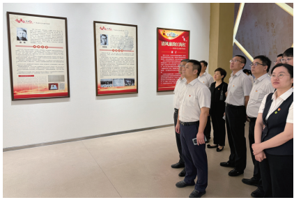
前往南通市革命纪念馆参观新四军苏中纪律建设专题展。

为庆祝中国共产党成立103周年,回顾党的光辉历程,同时深入推进党风廉政建设,切实加强党纪学习教育,引导党员干部主动思廉、践廉,营造风清气正的良好氛围,苏州银行南通分行党委组织辖内党员干部前往南通市革命纪念馆参观新四军苏中纪律建设专题展。