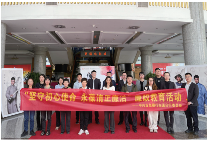
观看廉政越剧《风梅图》。

会议要求,分行员工行为管理工作要筑牢“三道墙”,让合规管理入脑入心:一是警示提醒竖起“防腐墙”,常怀“敬畏之心”,通过开展系列警示教育活动,强化“身边人、身边事”警示效果;二是严明制度压实“责任墙”,常怀“思齐之心”,坚持制度建设优先,强化管理制度化、制度流程化、流程信息化的内控理念,见“章”思齐;三是强化监督筑牢“高压墙”,常怀“警惕之心”,加强监督检查力度,业务条线、风险合规部门均要充分发挥职能作用,建立和落实检查责任制、监督机制,防止检查流于形式。