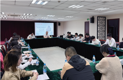
开展“青年谈清廉”主题活动。

参加观演的党员干部表示,将领会文艺作品的深刻内涵,不断加强学习,提升自己的业务能力和综合素质,注重个人品德修养,做到诚实守信、公正无私、廉洁奉公,始终用廉洁之光照亮前行的步伐。