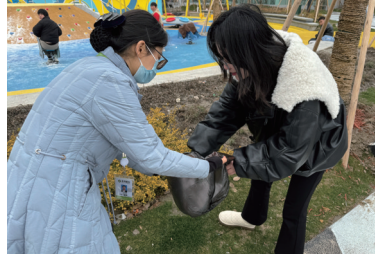
苏州银行南通分行组织开展“雷锋精神我接力 保护环境我参与”学雷锋主题活动。

蓝印花布的制作包含五道工序:雕花刻板,有规有矩;刮浆防染,无隙可乘;蓝靛浸染,一清二白;刮白去浊,取精去粕;手工晾晒,防腐固本,暗喻了中华优秀传统文化中的廉洁基因。在现场工作人员的指导下,大家体验了蓝印花布印染技艺,深深感受着“清正廉洁”的魅力,切实引导员工和家属守牢廉洁自律底线,筑牢拒腐防变家庭防线,营造注重家庭家教家风的浓厚氛围,以好家风促党风、带行风、正作风。