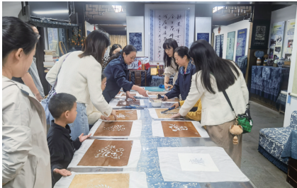
苏州银行南通分行党委在南通蓝印花布博物馆开展“传清廉家风 塑清白人生”家风行风共建活动。

同时,南通分行纪委书记结合《苏州银行员工行为禁令(2024年版)》及金融业警示教育案例,对不同岗位的青年员工们提出了工作要求,要严格遵守法律法规、监管规制、行业自律规范以及行内规章制度的规定,自觉抵制违法违规违纪行为,不断提升自我修养和综合素质,为南通分行高质量发展贡献一份力量。