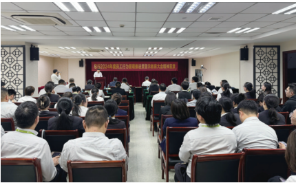
苏州银行南通分行召开总行2024年度员工行为管理推进暨警示教育大会精神宣贯会议。

参会人员充分认识到,作为金融从业人员应时刻警醒自己,注意工作中的廉政风险点,不断提高廉洁意识,厚植不想腐的根基,在分行内营造风清气正的干事氛围。