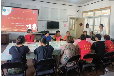
携手社区共同开展“月满中秋团圆 方寸之间话民俗”活动,走进社区宣传存款保险相关知识。

由分行党员、团员组成志愿者队伍,前往南通体育公园开展垃圾清理志愿服务活动,大家相互配合,分工明确,齐心协力,充分发挥不怕累、不怕脏的志愿服务精神,不仅用自己的实际行动践行了雷锋精神,生动体现了志愿服务宗旨,也得到了附近居民的高度赞扬。在雷锋精神的感召下,南通分行员工将继续践行雷锋助人为乐、无私奉献的精神,为构建和谐社会环境贡献自己的力量。