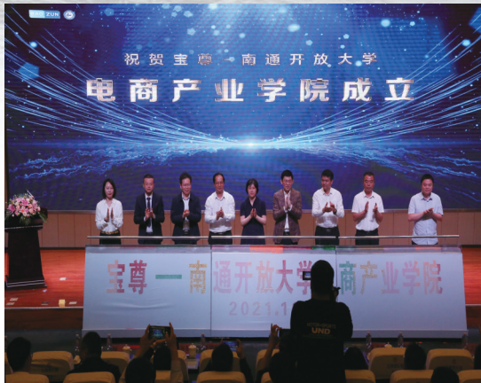
南通开放大学宝尊电商产业学院成立大会

促进产教深度融合,坚持校企协同育人。学校与多家企业建立了全面、紧密、深入的校企合作新机制,共建“宝尊电商”“永达电力科技”“中天智能制造”“华荣智能建造”等特色产业学院,打造多对象、多手段、开放式、模块化的创新训练环境,健全以产兴教、以教强业、良性互动的产教融合长效机制,在校企“双元”育人的布局中,为高能人才成长铺就坦途。