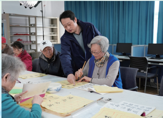
阳光养老公寓老年书法课堂