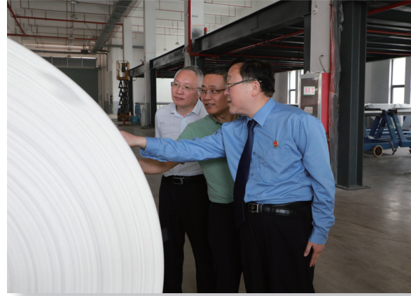
检察长带队赴辖区产业园区，送法上门，问需问计

“检察护企”，重在“护”、要在“实”。通州区检察院作为集中管辖全市知识产权案件的专门院，牢固树立以案释法、综合保护理念，为服务保障南通国家知识产权示范区建设提供法治助力。