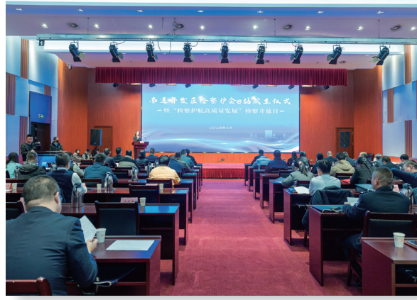
南通开发区检察院举办“护企e站”成立仪式

近日，开发区检察院对某企业经营整改情况进行“回头看”，检察官通过以案释法，给企业员工上了一堂生动的警示教育课。