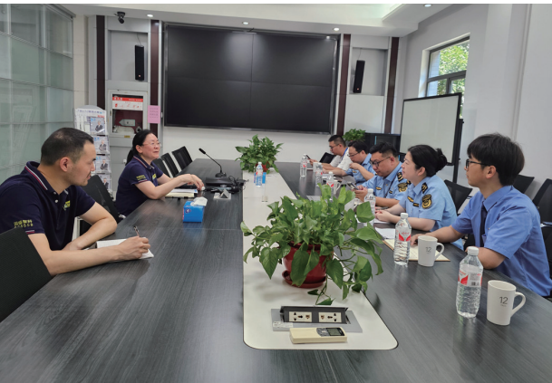
通州区检察院联合应急管理局等部门与企业开展座谈交流

“安全是职工的生命线，职工是安全的第一责任人。作为一线职工，一定要严守红线。”日前，通州区检察院联合区市场监督管理局走访辖区企业，并开展普法宣传活动。检察官以该院办理的一起涉嫌伪造、变卖国家机关证件案为例，向企业职工讲解规范生产的重要性。