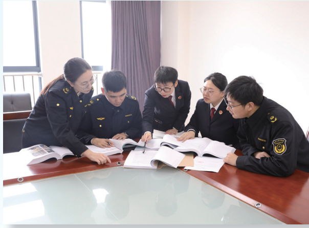
如皋市检察院的检察官与市场监管部门工作人员讨论案件

“检察官，你们新移送的‘空壳公司’案件，我局已经立案，并进入吊销清理程序。”近日，如皋市检察院行政检察部门的检察官接到了该市市场监管部门工作人员的反饋电话。