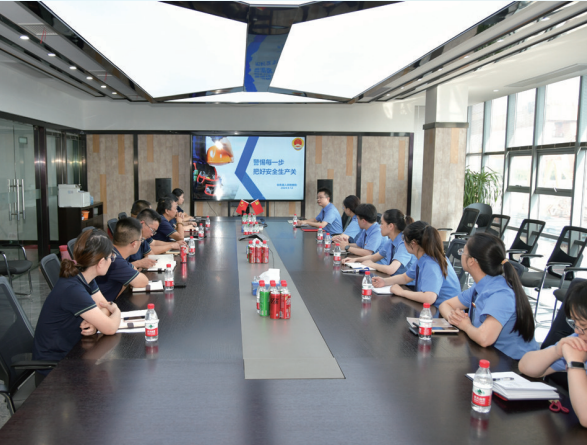
如东县检察院的检察官到企业普法

“检察护企”专项行动开展以来，如东县检察院立足检察职能，多措并举强化对各类市场主体依法平等保护，以法治力量护航企业高质量发展。