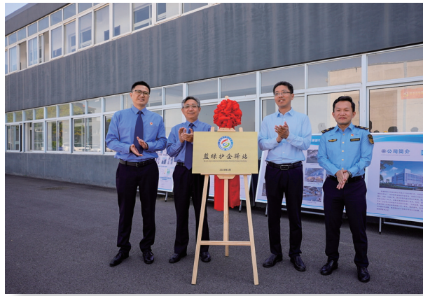
南通市、海门区两级检察机关和生态环境部门携手在海门江印染有限公司挂牌设立首个“蓝绿护企驿站”

“蓝绿护企驿站对我们帮助很大，在指导守法生产的同时，还引导做好环境保护工作。”近日，在南通市、海门区两级检察机关工作情况通报会上，当地某企业的负责人说道。