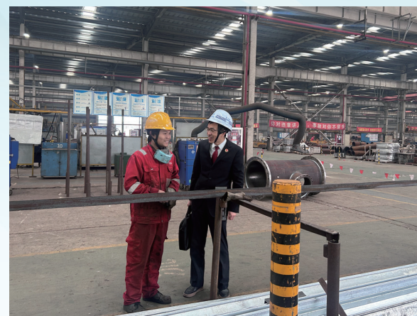
启东市检察院的检察官走访企业，了解企业需求

2024年以来，启东市检察院立足检察职能，着力打造“启检e企”工作品牌，构建“打击、监督、预防、宣教、保护”五位一体护航机制，全力保障法治化营商环境建设。