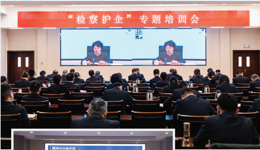
▲ 组织开展“检察护企”专题培训