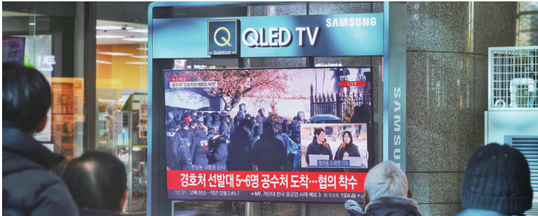
15日,民众在韩国龙山火车站观看尹锡悦被捕的电视直播。

公调处和警方人员15日凌晨抵达总统官邸,尝试再次执行对尹锡悦的逮捕令,同时执行对代行总统警卫处长职权的次长金成勋等人的逮捕令。