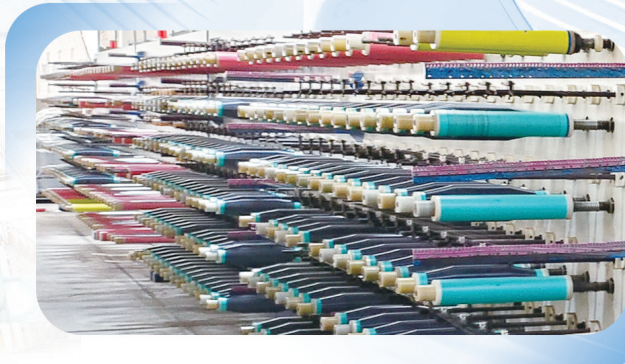
南通新帝克单丝科技股份有限公司