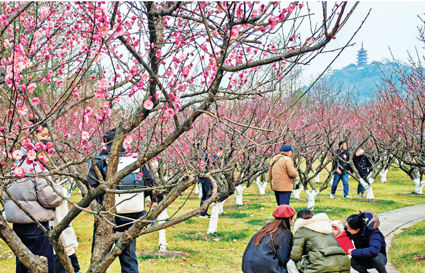
16日,南通狼山风景区“梅林春晓”大片春梅绽放,吸引众多游客和市民前来打卡。

此次清理范围包括检查排水口是否存在堵塞、破损等问题,组织养护人员加强日常维护,清理边沟、排水沟,防止杂物、淤泥堆积等。作业时,养护人员在南通市公路事业发展中心通州分中心巡查组的安全保障下,利用铁锹、十字镐、油锯等工具,对公路排水沟内的杂物垃圾进行清理,清除排水沟内积存泥沙,平整造型,保障排水系统正常运行。