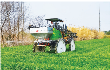
种植户进行小麦春管。

此外,悦来镇还加强了生产一线的服务保障。例如,指导农户对拖拉机、植保机、旋耕机等农机具进行全面检修和保养,帮助农户对接优质供应商,及时储备农机配件、油料、化肥、农药等。