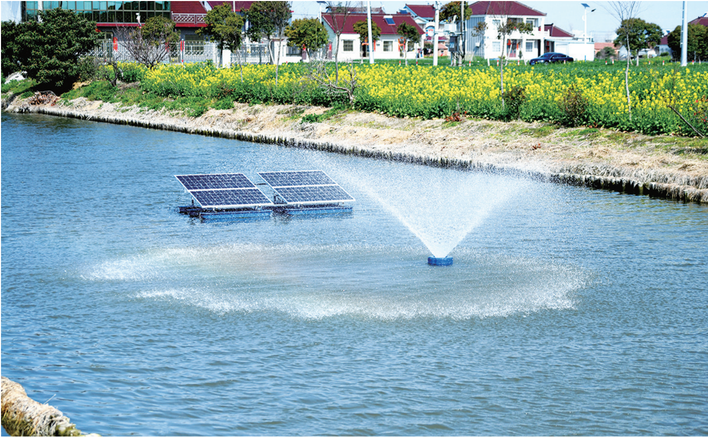
16日,在海安滨海新区富港村马坝桥河面上,漂浮式太阳能曝气机正在给河道水体增氧。近年来,海安全域推动农村生态河道建设,更多“河畅、水清、岸绿、景美”的幸福河湖,成为农村人居环境的亮丽风景线。