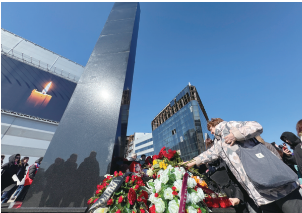
3月22日,在俄罗斯首都莫斯科近郊,一名女子向“克罗斯库城”音乐厅恐袭事件遇难者纪念碑献花。2024年3月22日晚,“克罗斯库城”音乐厅发生严重恐袭事件,造成144人死亡、551人受伤。

据美国媒体报道,F-47将接替F-22成为美空军第六代主力空中优势战斗机。预计整个项目总价值高达数千亿美元,单机造价超过3亿美元,仅工程和制造开发合同价值就超过200亿美元。