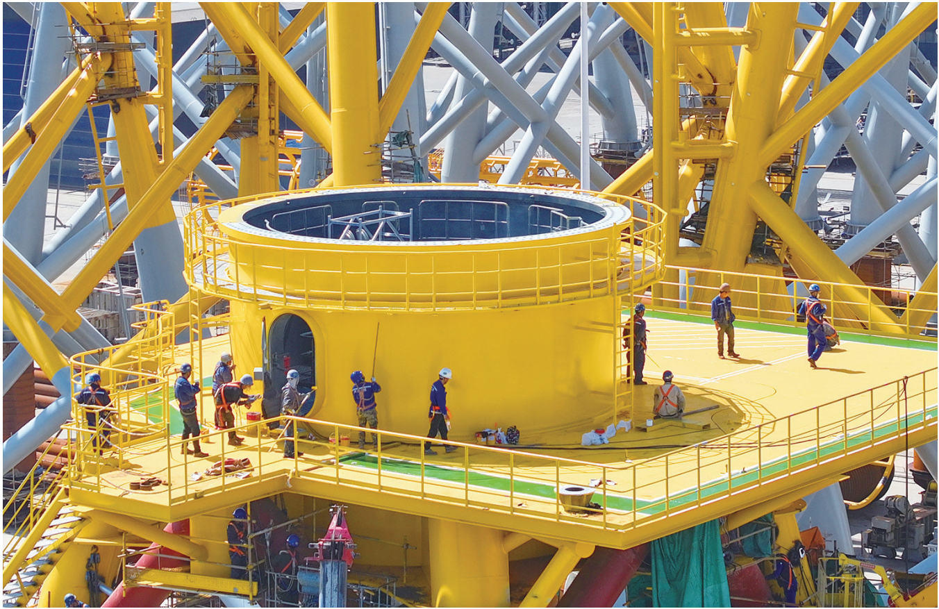
昨天，工人在通州湾高端装备临港产业园一家企业导管架上忙碌。眼下，通州湾高端装备临港产业园投产企业生产繁忙。据悉，该产业园重点布局海工装备、新能源装备等大型临港装备制造项目，已落户总投资超420亿元的22个项目，达产后预计实现年产值约530亿元。

本报讯（记者吴霄云）4月15日，被誉为“中国外贸晴雨表”的第137届中国进出口商品交易会（广交会）在广州开幕。记者从市商务局了解到，本届展会南通市参展规模继续保持历史高位，首期即组织125家优质企业、180个展位组成“南通方阵”，以智能化、绿色化产品矩阵亮相，全力抢滩全球市场。 从布展情况来看，南通参展企业呈现出三大亮点：一是展品结构显著升级，五金工具、智能家电、电子消费品等中高端制造产品占比超七成，集中展示南通制造业的技术创新成果；二是市场布局更加多元，企业普遍将东南亚、中东等“一带一路”新兴市场作为重点，积极拓展国际市场版图；三是创新元素突出，多家企业携新产品、新材料、新工艺登场，展示南通制造智能化、品质化、绿色化新趋势。 据悉，本届广交会采用“线上线下融合”的新模式，线下展分三期举办至5月5日。南通参展企业达406家次，展位总数645个，品牌展位168个，其中200多家企业将亮相二期、三期展会，重点展示家纺、服装等传统优势产业的最新产品和创新实力，并利用广交会平台寻找新市场、拓展新渠道。