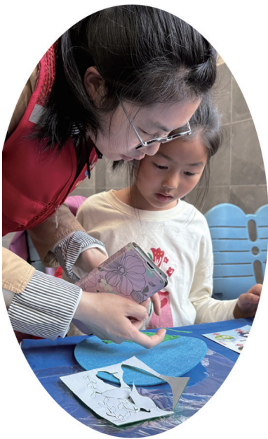
▲12日,唐闸镇街道高店社区、闸东社区携手永怡小学,以“袋藏书卷 诗跃指尖”为主题,开展趣味阅读活动。