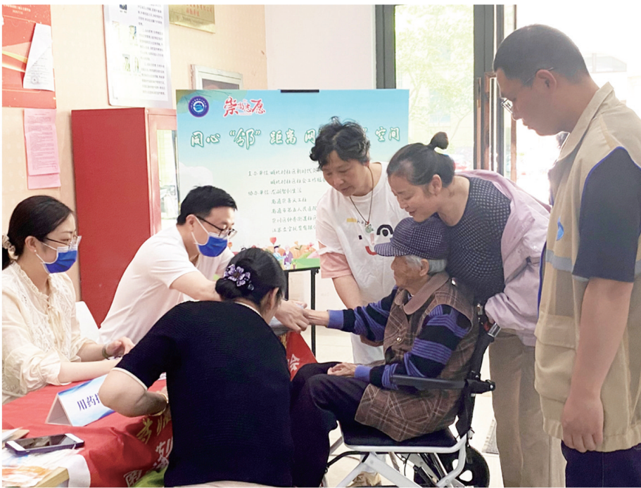
▲14日上午,钟秀街道城北村社区在五洲御锦城网格党群服务站开展“同心‘邻’距离 网聚‘益’空间”活动。活动中,第五人民医院医生为社区居民测量血压。