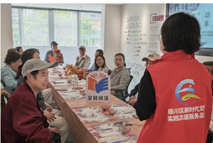
▲14日,唐闸镇街道怡园社区、横河社区组织开展“‘签’动智慧 ‘阅’享人生”主题阅读活动。