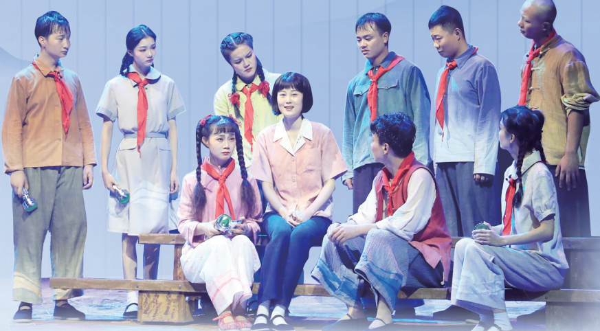
《青铜葵花》《草房子》剧照

舞台布景、灯光设计、音乐烘托等手段,将文学中的意境转化为可视可感的舞台画面,《草房子》中油麻地的乡村景致,《青铜葵花》中的芦苇荡,都在舞台上获得了新的生命。这种转化不是简单的场景再现,而是对文学意境的深度挖掘和艺术再现。