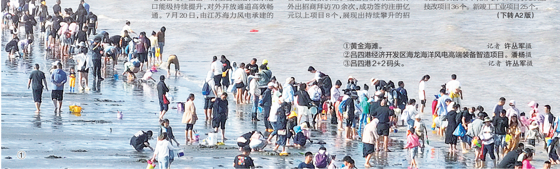
①黄金海滩。 记者 许丛军摄 ②吕四港经济开发区海龙海洋风电高端装备智造项目。潘杨摄 ③吕四港2+2码头。 记者 许丛军摄

向海图强,启东突破传统渔港定位,向现代化、多功能、国际化港口跃升,突破近海作业局限,