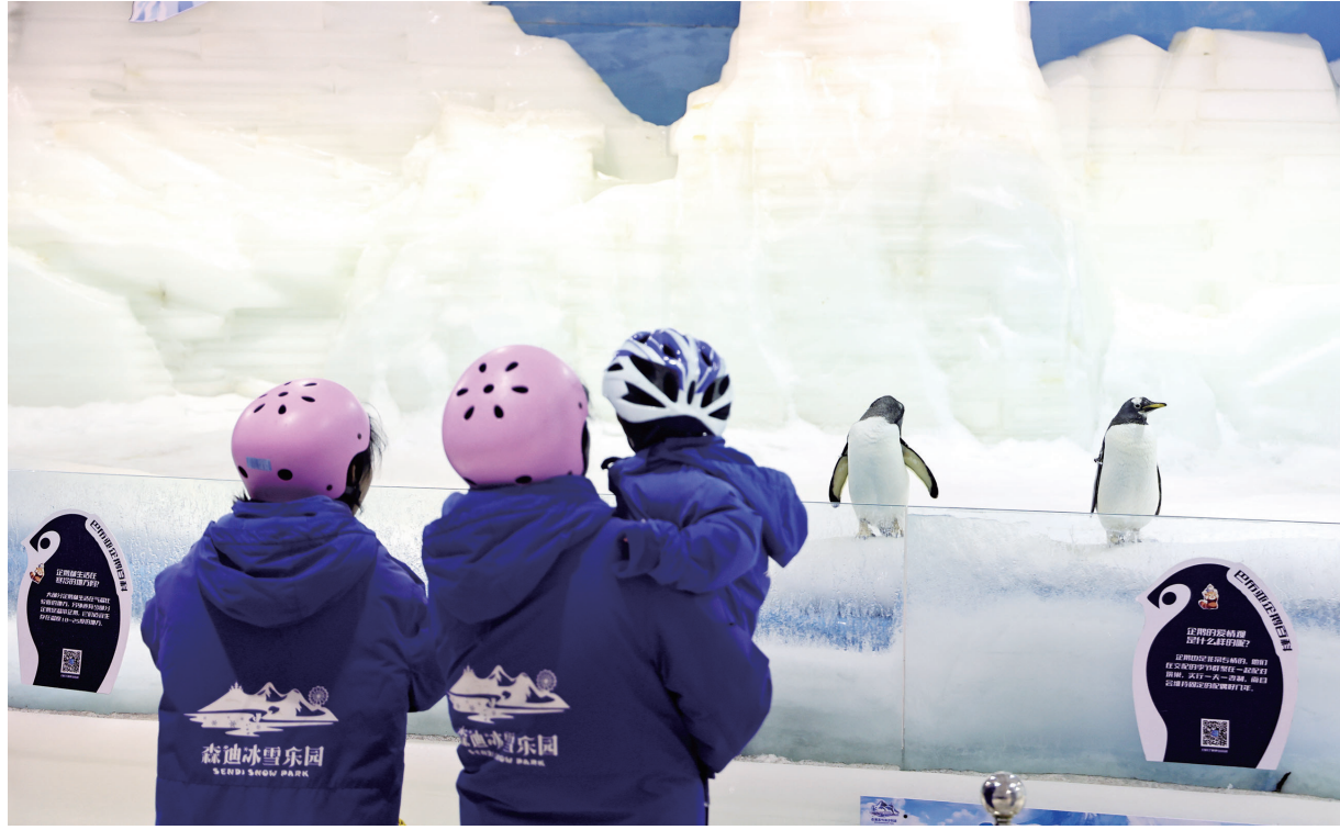
昨天,人们在南通森迪冰雪海洋乐园内观看巴布亚企鵝。连日来,我市迎来大范围、长时间高温闷热天气,不少市民和游客来到南通森迪冰雪海洋乐园休闲游玩,享受别样清凉。记者 徐培钦 实习生 张婧文摄

本次“动态公交”开设的运行范围东至牡丹江路,西至尚德路,北至银河路、湘江路、运盐河路,南至金桥路等区域,覆盖面积约6.51平方公里,共设有128个站点。