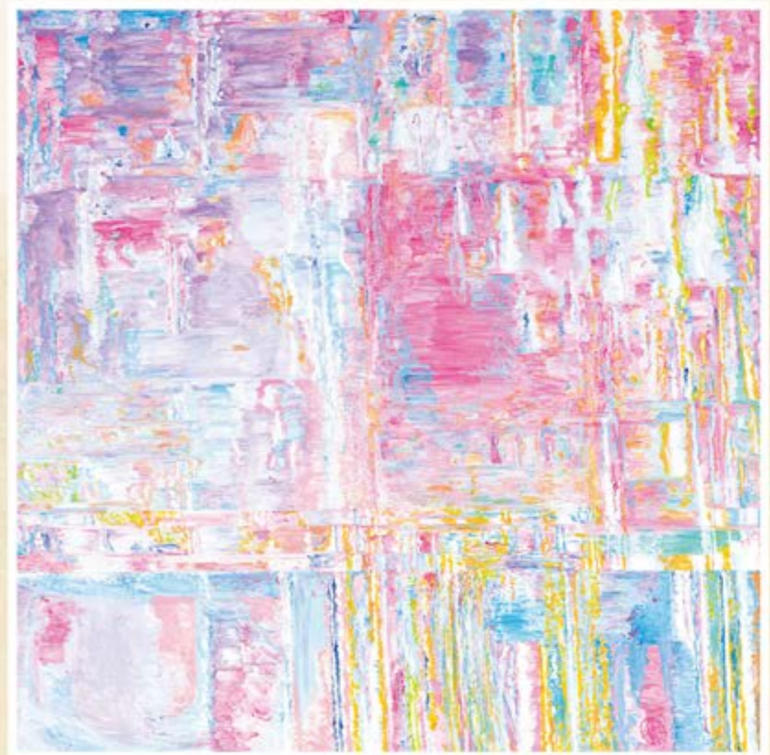
布面油彩 荷塘系列之3 (200cmx200cm) 2023年