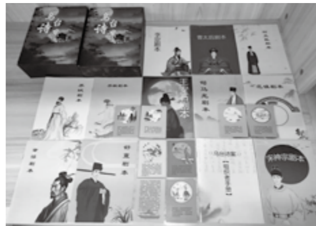
图1:苏轼乌台诗案剧本杀