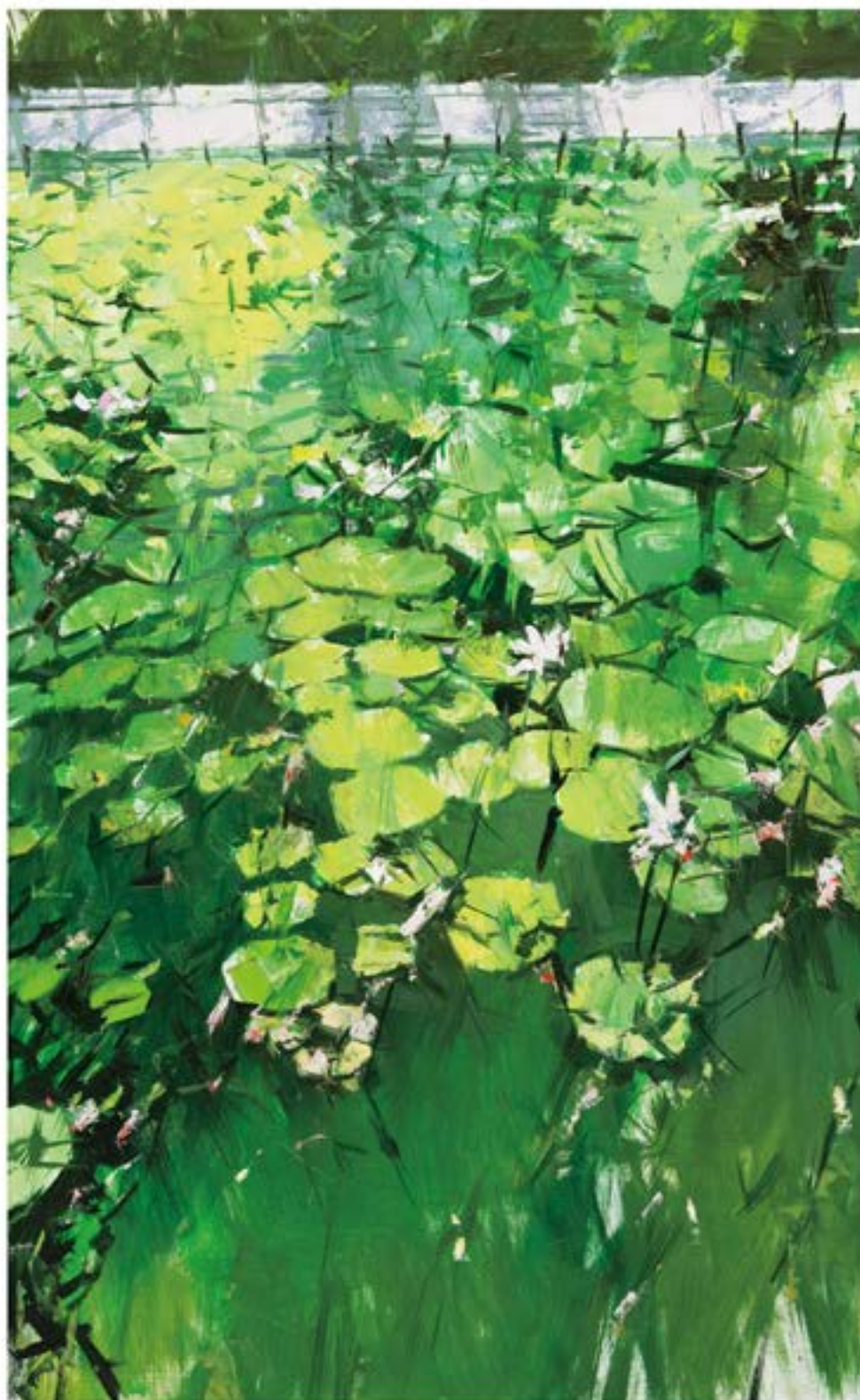
布面油彩 荷花池头之三（138cm×90cm）2023年