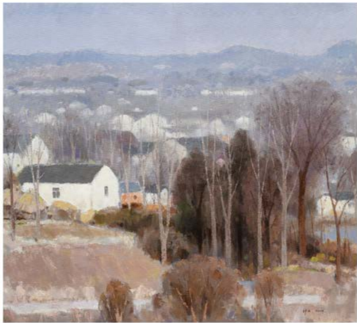
布面油彩 冬日暖阳（152cm×168cm）2014年